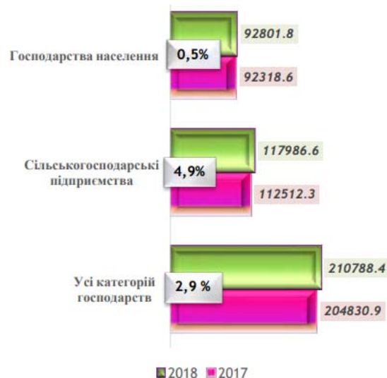
Рис. 4. Поголів'я птиці, тис. голів

числі в сільськогосподарських підприємствах – на 5474,3 тис., а у господарствах населення на 483,2 тис. голів (рис. 4).