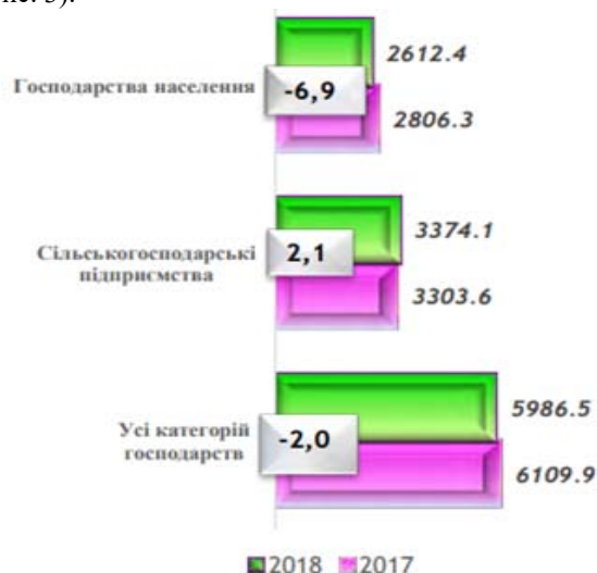
Рис. 3. Поголів'я свиней, тис. голів

У 2018 році в усіх категоріях господарств зменшилося поголів'я свиней, порівняно з 2017 роком, на 123,4 тис. голів, у тому числі в господарствах населення – на 124,3 тис. голів, а в сільськогосподарських підприємствах – збільшилося на – 70,5 тис. голів (рис. 3).