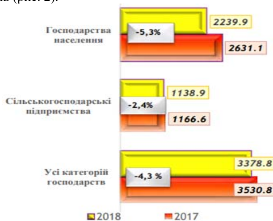
Рис. 2. Поголів'я великої рогатої худоби, тис. голів

Поголів'я великої рогатої худоби на 1 січня 2019 року в усіх категоріях господарств зменшилося проти відповідного періоду 2018 року на 152,0 тис. голів, у тому числі в сільськогосподарських підприємствах – на 27,7 тис., у господарствах населення – на 124,3 тис. голів (рис. 2).