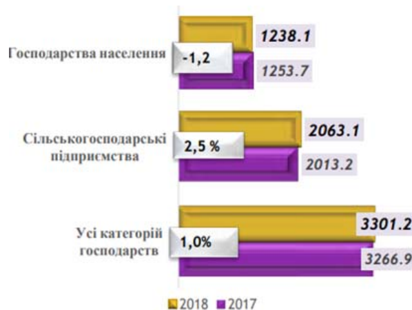
Рис 1. Обсяги реалізації худоби і птиці у живій масі, тис. тон

У 2018 році найбільше реалізували на забій худоби та птиці всіма категоріями господарств Вінницької, Черкаської, Дніпропетровської та Київської областей, що становить 47,0% худоби і птиці від загальних обсягів реалізації в цілому по Україні (3301,2 тис. т).