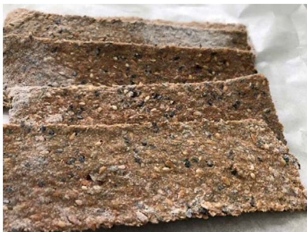
Рис. 1. Зовнішній вигляд хлібців із борошна спельти

Технологія приготування хлібців полягає у наступному: попередньо очищене насіння подрібнюють. Висівки і борошно просіюють. Усі сухі компоненти перемішують, додають кефір та воду. Замішують тісто, яке вистоюється 20 хв. Потім розкачують хлібці прямокутної форми 5×13 см та висушують їх при t = 80\text{ }^{\circ}\text{C} протягом 4...5 год. Охолоджують за кімнатної температури протягом 30 хв.