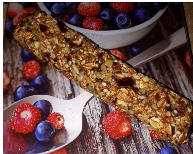
Рис. 2. Батончик із пластівців спельти

Готові вироби оцінювали за органолептичними показниками. Батончик із пластівців спельти має прямокутну форму, рифлену без тріщин поверхню; хрумку консистенцію, світло-коричневий колір і виражений горіховий аромат. Зображення готового виробу подано на рис. 2.